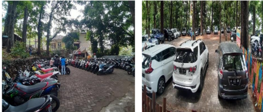
Gambar 1. Tempat Parkir Air Terjun Putuk Truno

Fasilitas fisik merupakan fasilitas yang dapat terlihat seperti sarana dan prasarana. Sarana merupakan alat penunjang wisata yang dapat berupa papan balihok arah menuju tempat wisata, tempat sampah, tempat duduk, toilet, loket tiket wisata, tempat parkir, spot foto dan kegiatan lain didalamnya. Sedangkan prasarana yaitu penunjang utama dalam wisata seperti tempat wisata disini merupakan Air Terjun Putuk Truno yaitu kebersihan tempat wisata, keselamatan dan keamanan pengunjung. Berikut ini gambar sarana dan prasarana yang dimiliki Pariwisata Air Terjun Putuk Truno Prigen Pasuruan: