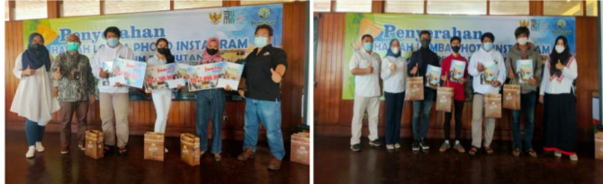
Gambar 6. Pemberian Hadiah Lomba Photo Instagram Air Terjun Putuk Truno

Dalam penyelenggaraan wisata Kesatuan Bisnis Mandiri Perum Perhutani di Wisata Air Terjun Putuk Truno Prigen Pasuruan juga memberikan fasilitas berupa program lomba fotografi yang bisa diikuti pengunjung. Program ini diadakan bertujuan agar dapat menarik minat fotografer agar dapat memperkenalkan wisata dan mengasah seni dibidang fotografi. Berikut pemberian hadiah program fotografi Kesatuan Bisnis Mandiri Perum Perhutani di Wisata Air Terjun Putuk Truno Prigen Pasuruan.