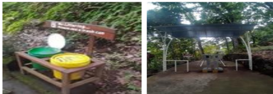
Gambar 3. Tempat Sampah dan Masuk Wisata Air Terjun Putuk Truno