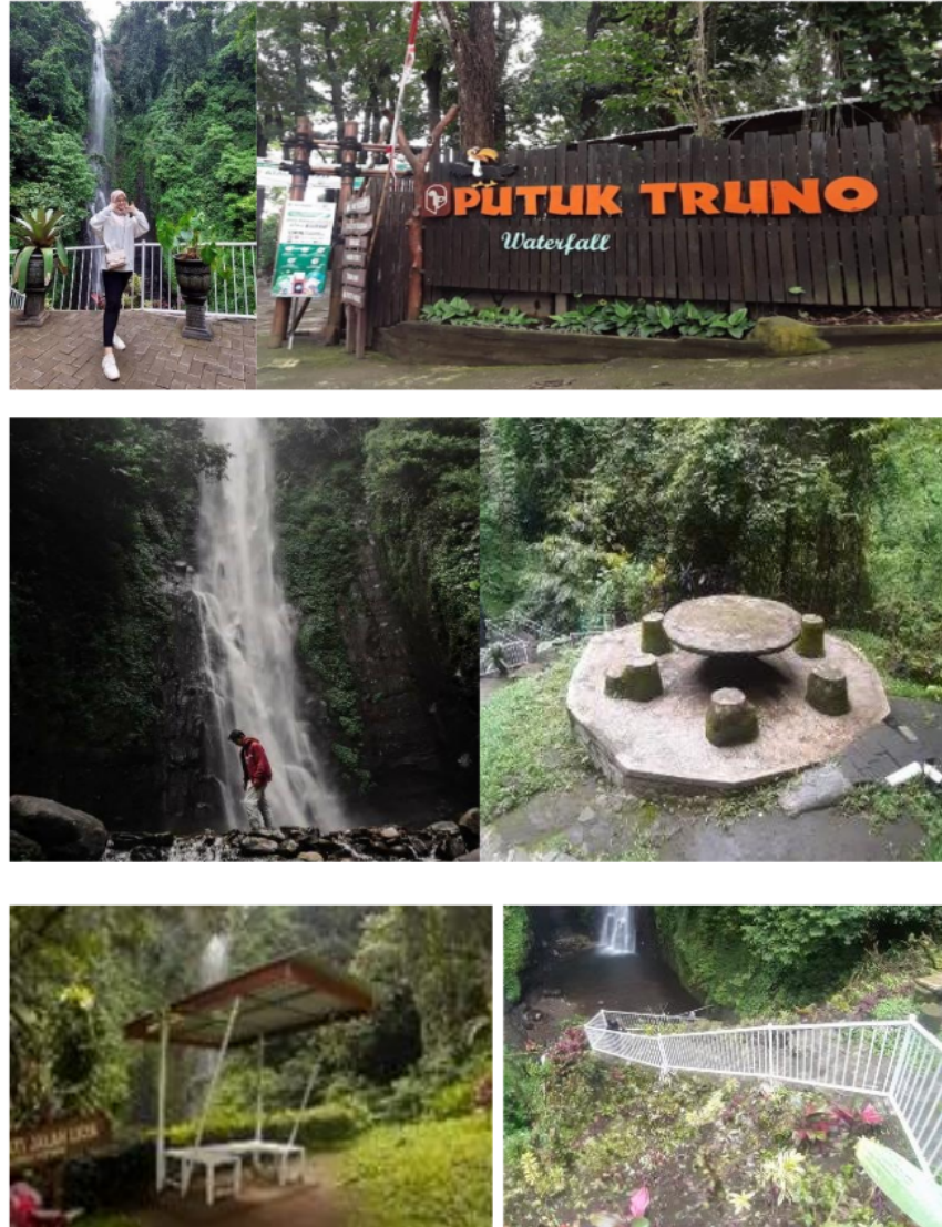
Gambar 4. Spot Foto Wisata Air Terjun Putuk Truno

Adapun beberapa fasilitas yang diberikan oleh pengelola guna untuk memberikan kenyamanan dalam berwisata. Pengunjung dapat dimanjakan dengan panorama disekitar tempat wisata. Selain itu, pengunjung dapat pula menemukan spot foto yang bisa digunakan untuk mengabadikan momennya. Berikut spot foto yang dimiliki tempat wisata air terjun putuk truno: