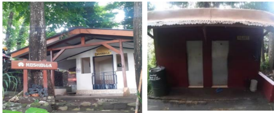
Gambar 2. Mushola dan Kamar Mandi Air Terjun Putuk Truno