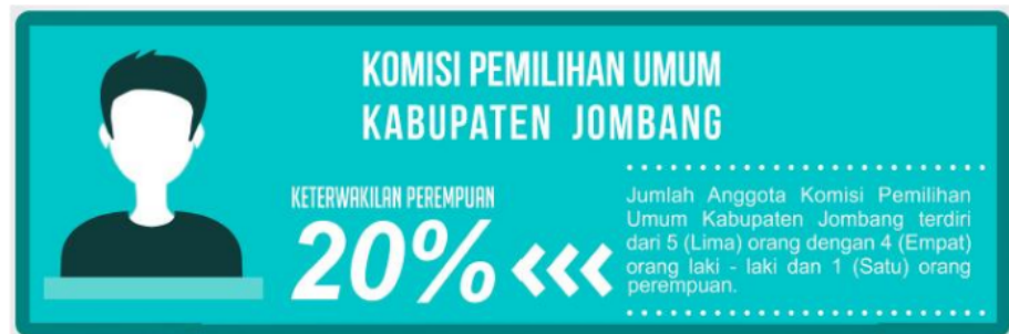
Gambar 1. Keterwakilan perempuan penyelenggara Pemilu tahun 2019 tingkat KPU Kabupaten Jombang

Data berikut ini menggambarkan tentang kondisi keterwakilan perempuan penyelenggara pemilu di Kabupaten Jombang. Pada gambar 1 menunjukkan prosentase keterwakilan perempuan penyelenggara pemilu di tingkat komisioner KPU Kabupaten Jombang. Data tersebut menunjukkan tingkat keterwakilan perempuan penyelenggara pemilu sebesar 20% menunjukkan masih belum terpenuhinya kuota keterwakilan perempuan. 1 perempuan dari 5 anggota komisioner menunjukkan kondisi yang belum ideal sebagaimana telah diinstruksikan dalam undang-undang.