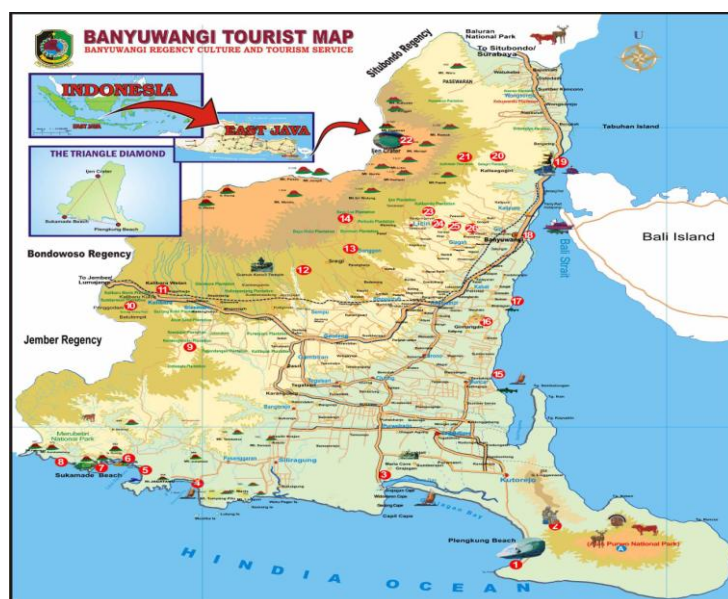
Gambar 1. Peta Wisata Banyuwangi