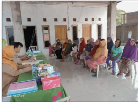
Gambar 1.1 Sosialisasi Kesehatan Lansia di Desa Mulung

yang disampaikan mengenai pentingnya program bina keluarga lansia untuk meningkatkan kesejahteraan dan kualitas hidup para lansia. Penyaluran informasi ini dilakukan secara langsung dan tidak langsung sebelum pelaksanaan, melalui undangan dan media whatapps. Akan tetapi, tidak semua masyarakat di Desa Mulung mengetahui adanya program bina keluarga lansia dikarenakan jarang ada di rumah karena kesibukan bekerja untuk membiayai kebutuhan hidup. Jika keluarga yang di dalamnya lansia itu sendiri berkendala lupaditambah kondisi kesehatan fisik yang menurun mengakibatkan tidak bisa mengikuti pelaksanaan kegiatan program. Berikut gambar mengenai pelaksanaan sosialisasi secara langsung dari Puskesmas Driyorejo serta penyaluran informasi melalui undangan dan media komunikasi whatapps.