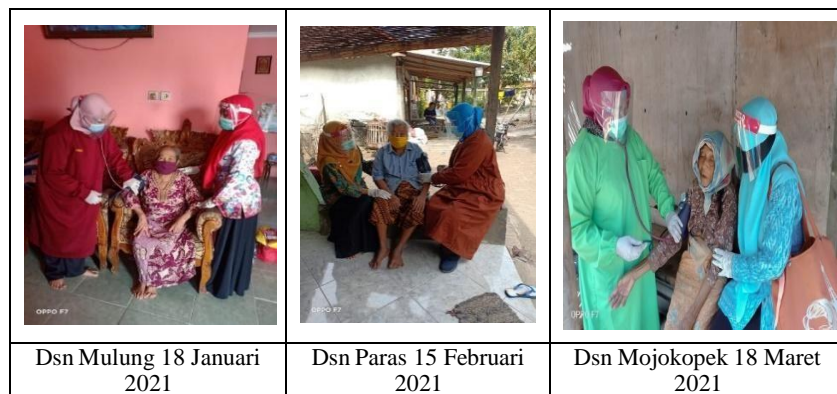
Gambar 1.3 Perawatan Lansia